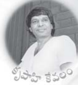
శ్రీ సాహిత్య కవయిత్రి

ఫుల్ ఫిల్ మెంట్ అంటే చనిపోయిన తరువాత వచ్చేది కాదు. ఏ చిన్న కోరిక మనలో కలిగినా మనలో ఒక గ్యాప్ ఏర్పడుతుంది. ఆ గ్యాప్ నింపుకోవడానికి పడే తపన వలన ఆ కోరికను తీర్చమని బాబాని అడిగి వారి ద్వారా ఆ కోరిక తీర్చుకొని మనలోని గ్యాప్ ని ఫుల్ చేసుకోవడమే మనం చేసుకోవలసిన సాధన. బాబాను ప్రతి చిన్న కోరికను మనం కోరి తీర్చుకుంటుంటే చివరికి