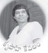
శ్రీ సాహిత్య కవయిత్రి